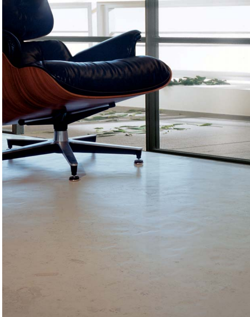
Lastra a pavimento, flooring slab