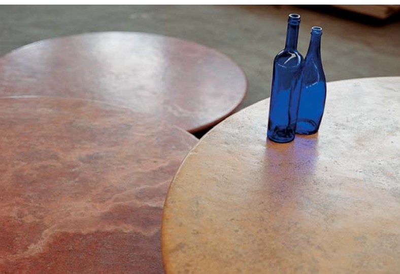
Piani tavoli, diametro 140 cm, spessore 2/3 cm Tables, diameter 140 cm, 2/3 cm thickness Dolomya Travertino Giallo e Travertino Rosso