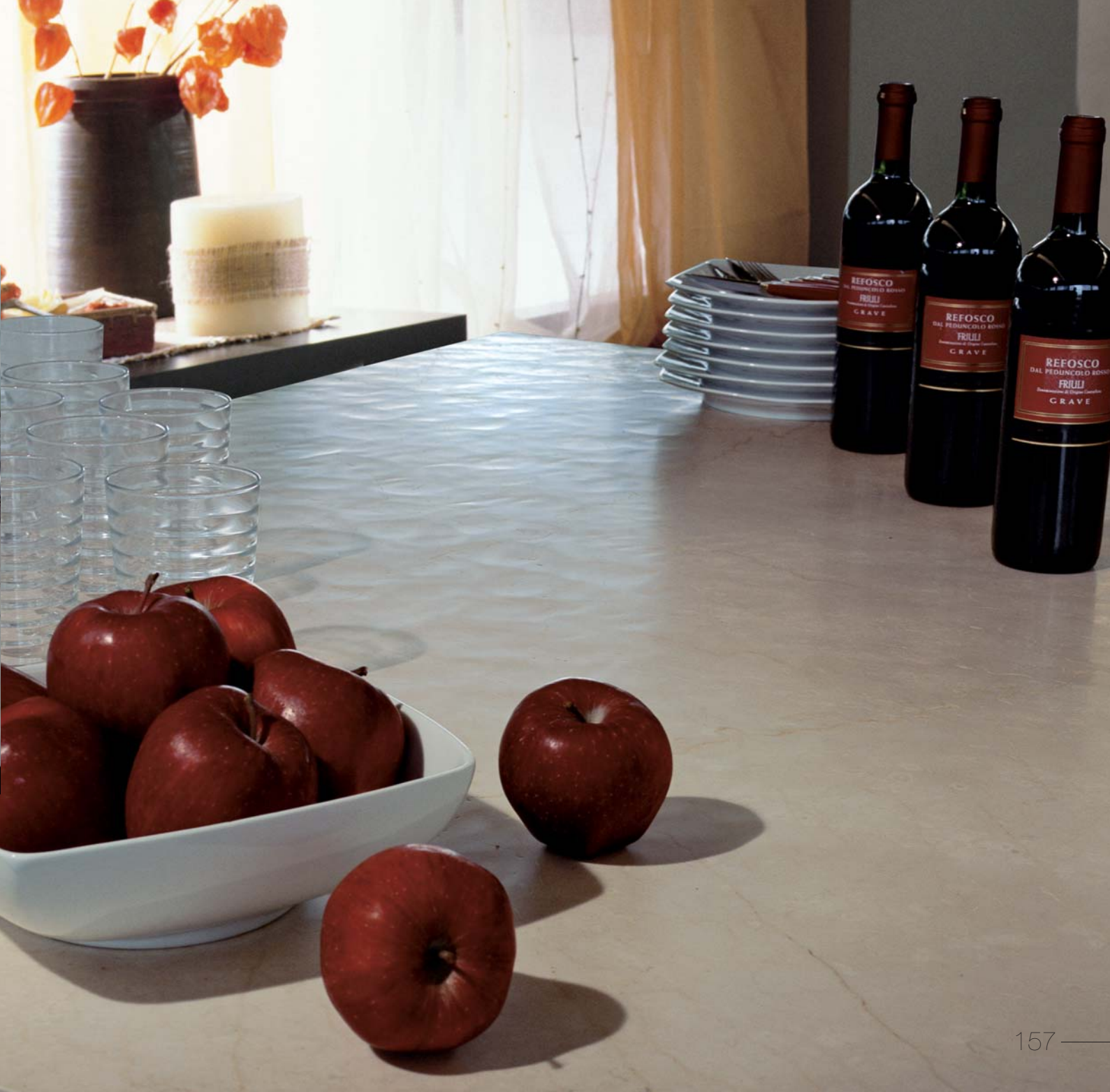
Piano tavolo, spessore 2 cm Table, 2 cm thickness Dolomya Botticino