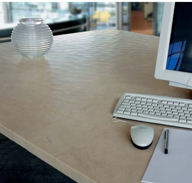
Piano tavolo, spessore 3 cm Table, 3 cm thickness Dolomya Crema Marfil