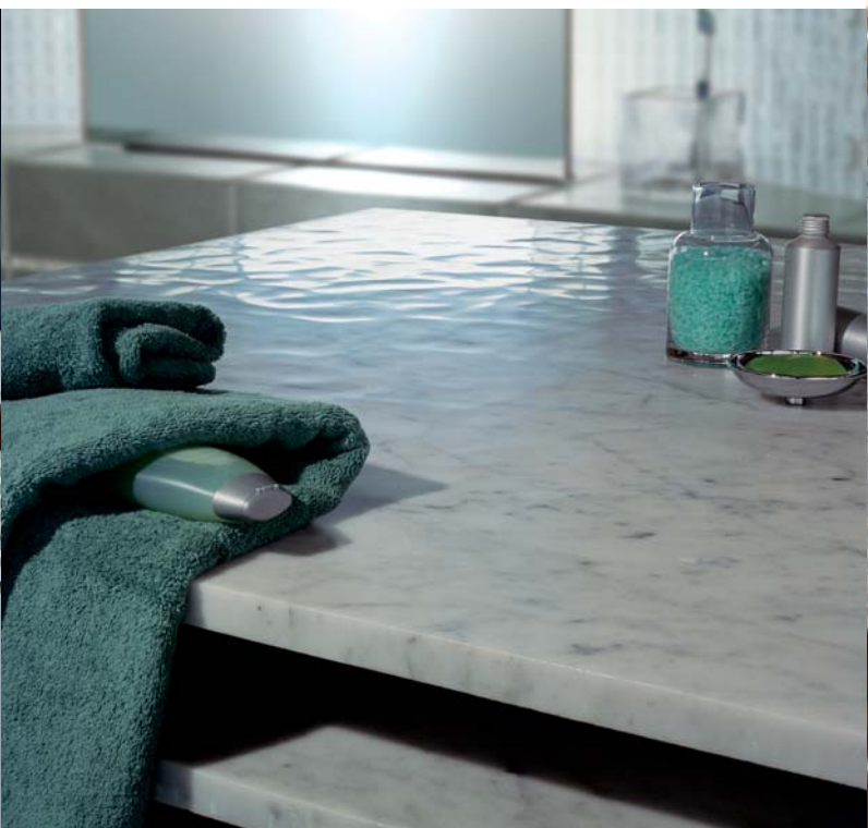
Piano tavolo, spessore 3 cm Table, 3 cm thickness Dolomya Bianco Carrara